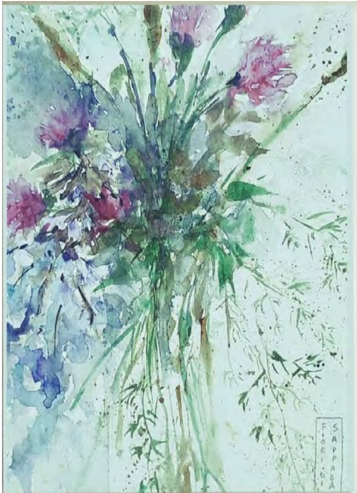
Acquerello di Anna Andassio