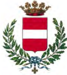
Cividale del Friuli