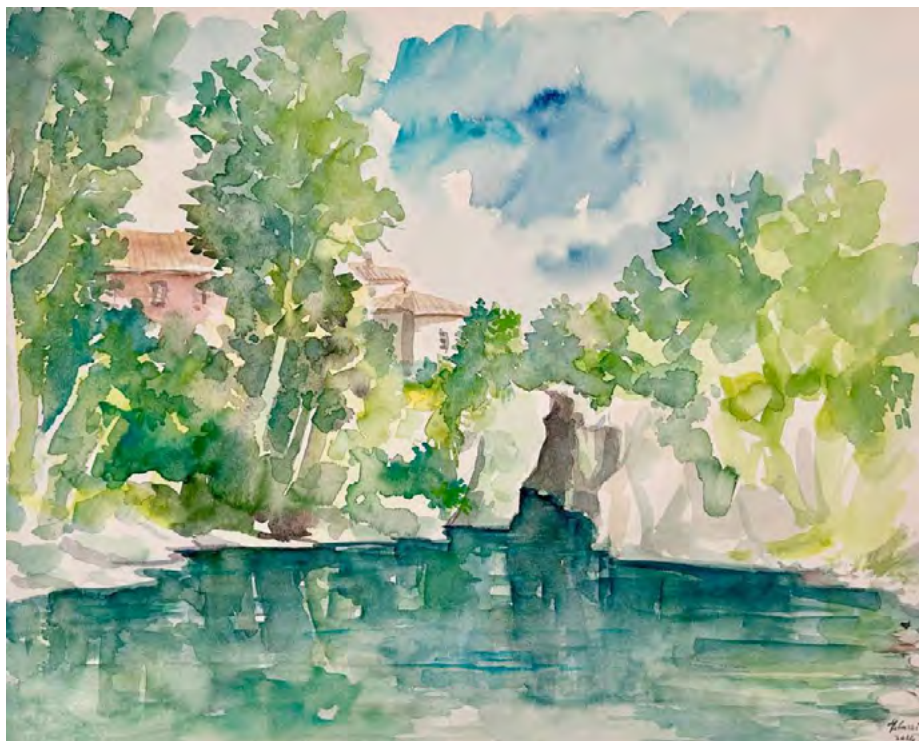
Acquerello di Renato Paoluzzi: il Natisone a Premariacco