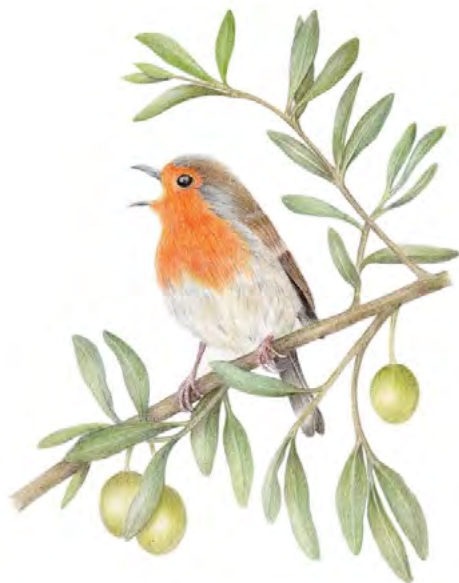
Pettirosso Disegno di Simonetta Manzini